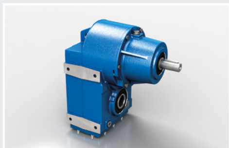
IS Med indgangsaksel