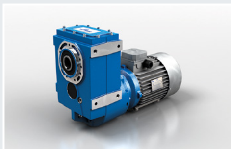
CS Med kompaktmotor